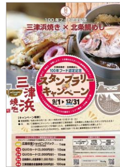
三津浜焼き×北条鯛めしスタンプラリーを開催 愛媛県「三津浜焼き」「北条鯛めし」