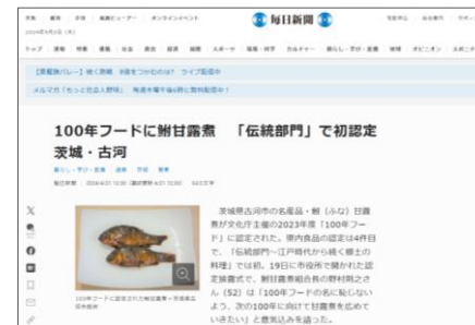
毎日新聞オンライン