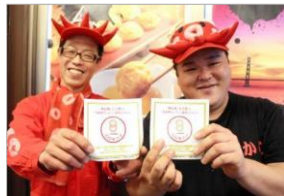
「100年フード」ステッカーを配布 兵庫県「明石焼（玉子焼）」