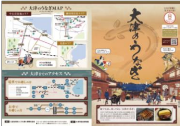
滋賀県「大津のうなぎの食文化」