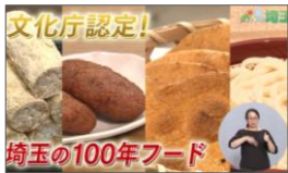
埼玉県公式チャンネル