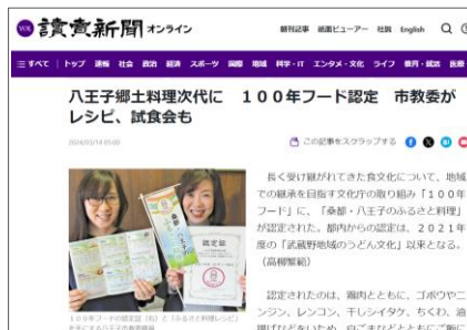
読売新聞オンライン

東京新聞、京都新聞、茨城新聞、神戸新聞、岐阜新聞、陸奥新報、上毛新聞、河北新報、中国新聞、中日新聞、大分合同新聞、岩手日日新聞、北海道新聞、沖縄タイムス、北海道新聞、等