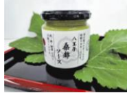
八王子市教育委員会学校給食課 ×東京都「桑都・八王子のふるさと料理～桑都焼き・かてめし～」