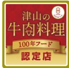
「100年フード」啓発ステッカーとポスターを制作、配布 岡山県「津山の牛肉料理」