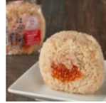
ファミリーマート ×宮城県「はらこめし」