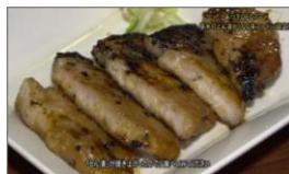
厚木市公式チャンネル