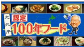
日本テレビ「世界一受けたい授業」

NHK各局、日本テレビ、青森テレビ、高知さんさんテレビ、群馬テレビ、名古屋テレビ、福島中央テレビ、読売テレビ、東海テレビ、テレビ新潟、南海放送、テレビ大分、あいテレビ、サガテレビ、琉球放送、札幌テレビ放送等