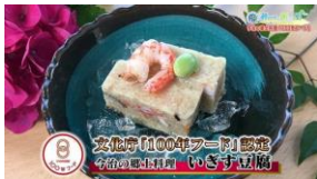
南海放送「瀬戸内の新しい風+」