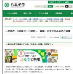
東京都「桑都・八王子のふるさと料理～桑都焼き・かてめし～」