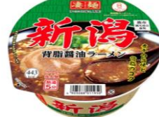
ヤマダイ×新潟県 「背脂ラーメン」