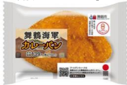
ローソン×広島県 「海軍ゆかりの食文化」