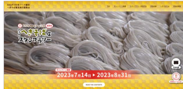
へぎそば店スタンプラリーを開催 新潟県「へぎそば」