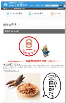
高知県「土佐宗田節」