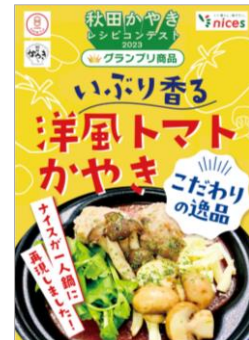
かやきレシビコンテストを開催、グランプリレシピは商品化 秋田県「秋田かやき」