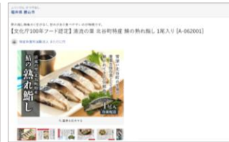
福島県「勝山北谷の鯖の熟れ脂し」