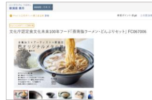
新潟県「背脂ラーメン」