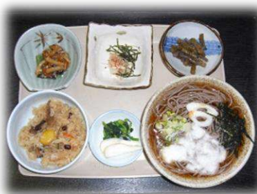
大山おこわ定食 1,400円

大山おこわ定食 1,300円 米子屋定食 1,400円 鮎定食 3,000円～ 山菜定食他 2,000円～