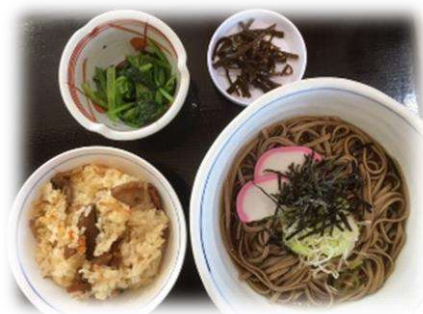
大山日本遺産定食 1,000円

鳥取県日野郡江府町江尾 2000 ☎0859-75-2400 🕒11時半～14時 🗓不定休、8/12～15、 12/27～1/5(電話で要確認)