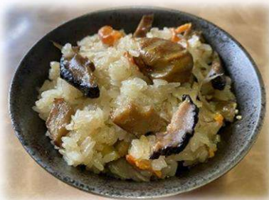
日替り定食 800円 (大山おこわは木曜のみ)